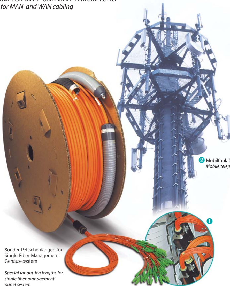
2 Mobilfunk-Sendemast Mobile telephony mast

Sonder-Peitschenlängen für Single-Fiber-Management Gehäusesystem